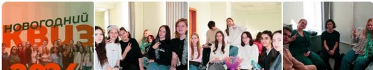
Фото Видео Клипы Мероприятия Файлы