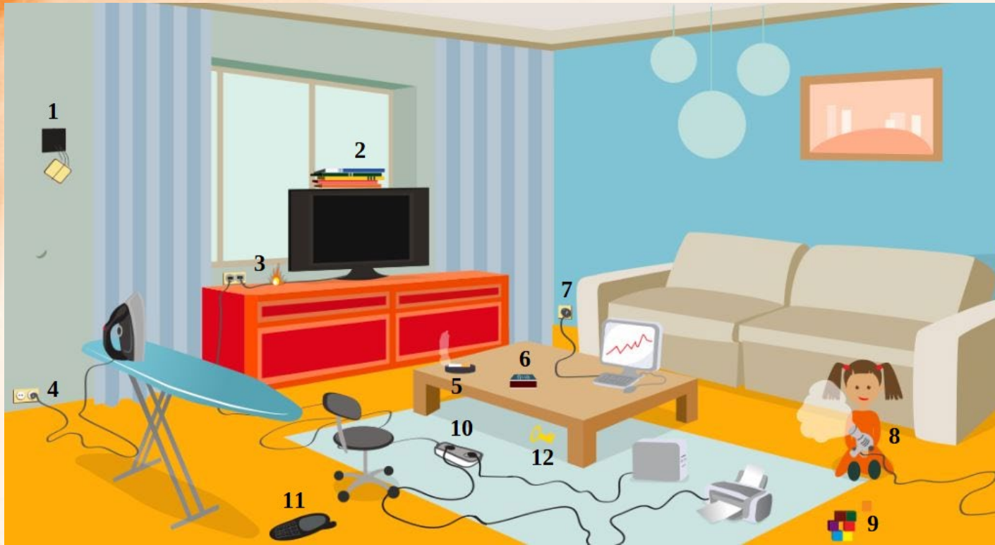
Рис. 3 Проверь найденные нарушения пожарной безопасности в гостиной