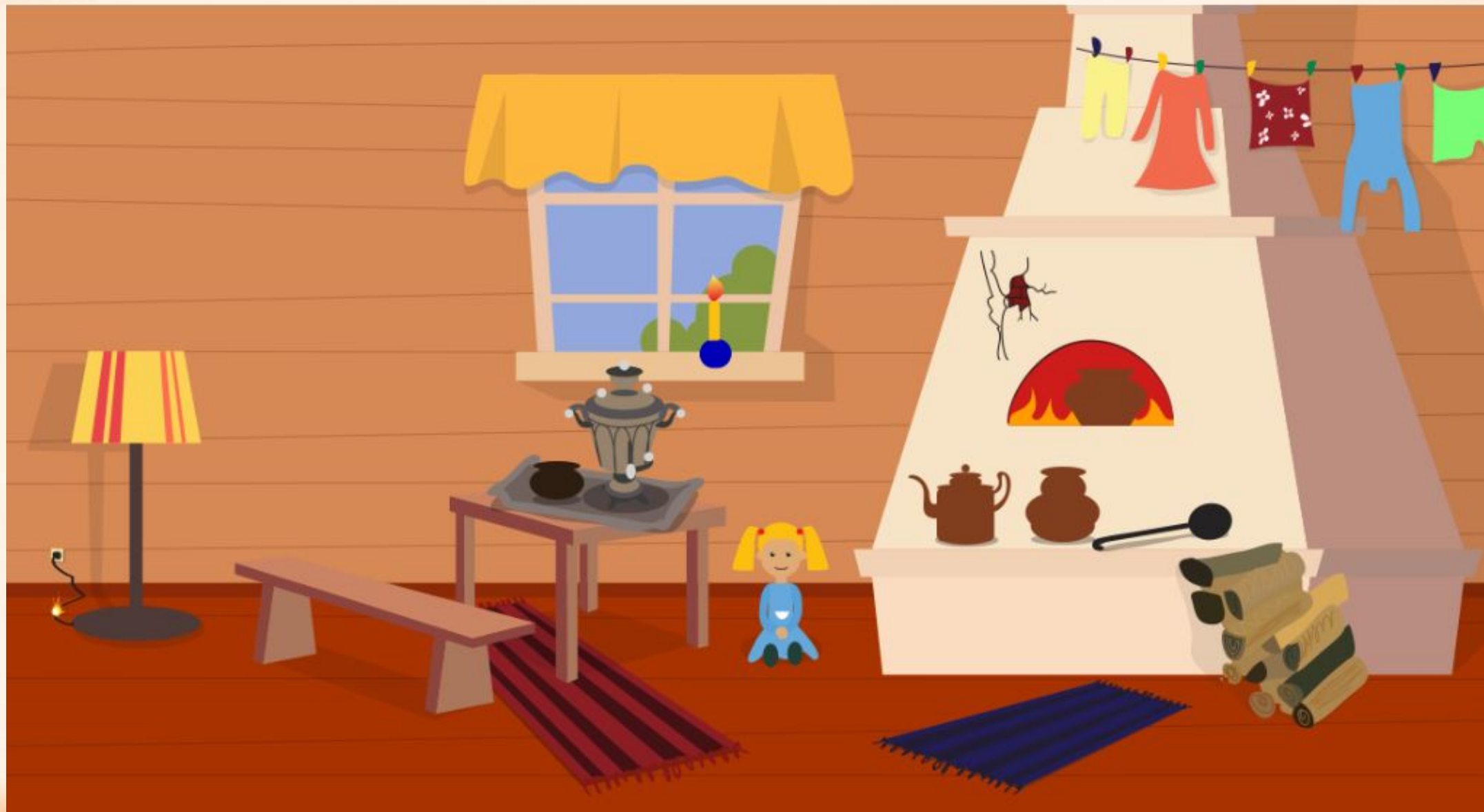
Рис. 1 Найди нарушения пожарной безопасности в доме (8 нарушений)