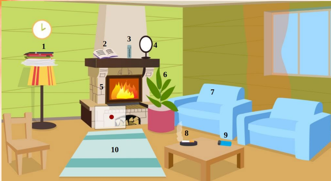
Рис. 4 Проверь найденные нарушения пожарной безопасности в гостиной