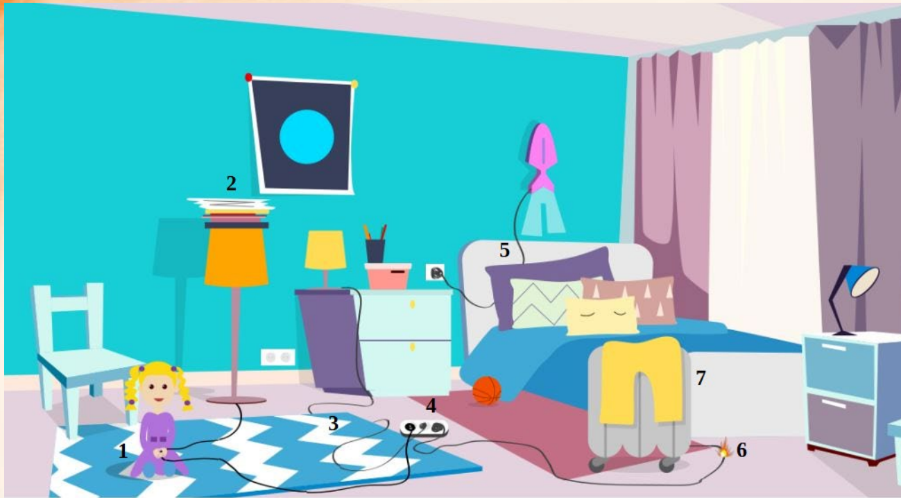
Рис. 5 Проверь найденные нарушения пожарной безопасности в детской