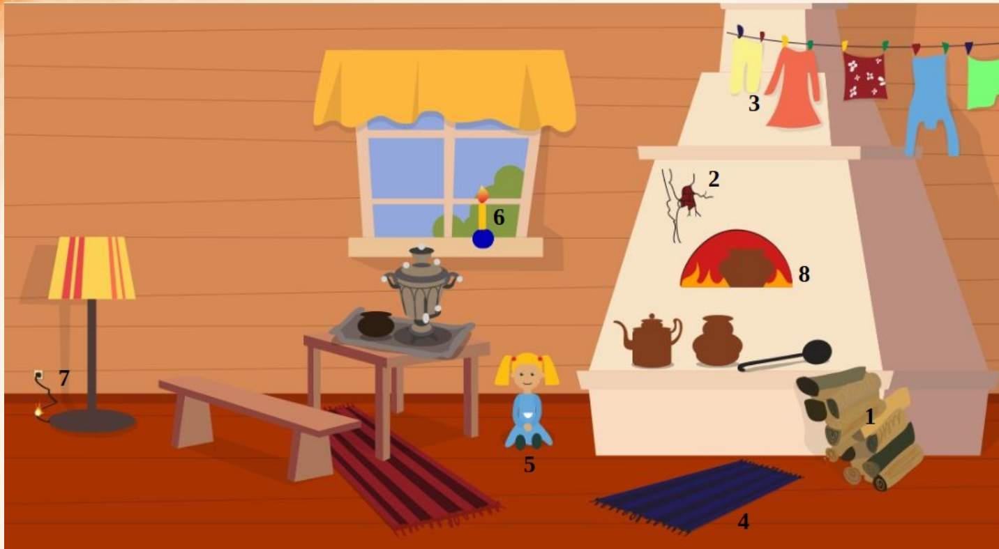
Рис. 1 Проверь найденные нарушения пожарной безопасности в доме